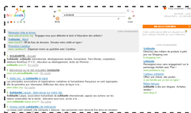
PAGE DE RESULTAT